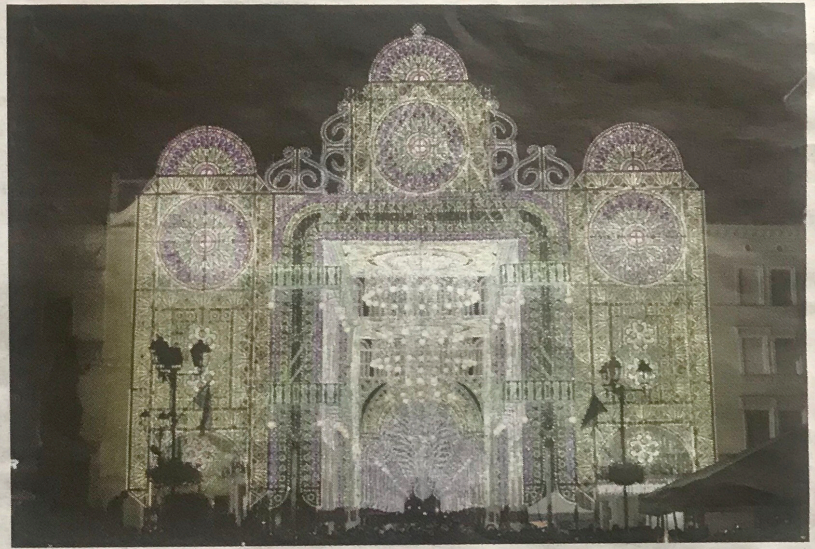
Reginys: pagrindinis festivalio akcentas – išpūdingi vartai ir Turgaus gatvėje išsidėsčiusios šviečiančios arkos.