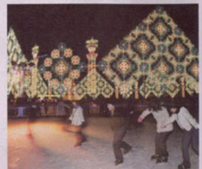
서울광장의 스케이트장. Mariano Light