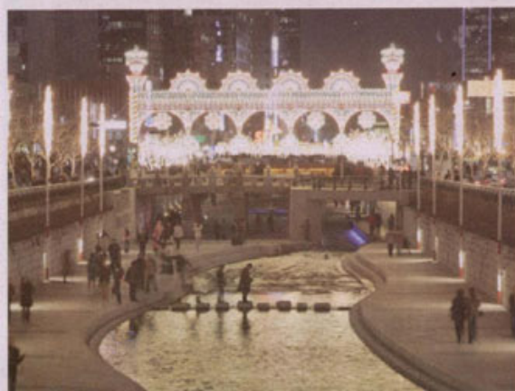
청계광장에서 아래로 내려본 모습. Mariano Light