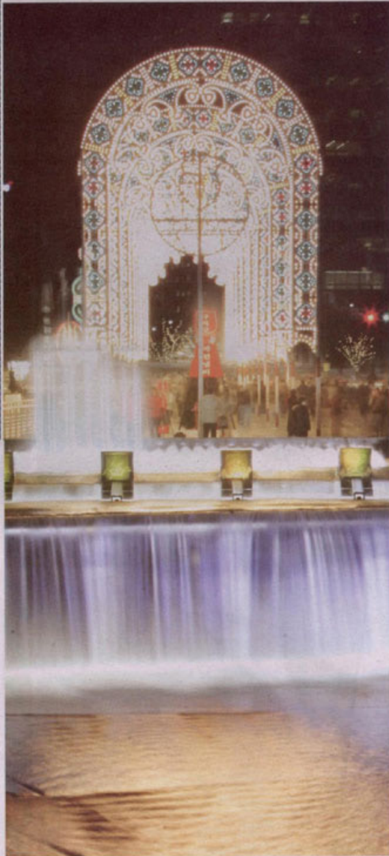
모전교에서 바라본 청계천 광장. Mariano Light